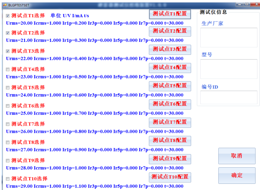
图 3 标准装置测试参数设置

在参数设置界面可以对 T1-T10 每个点的具体输出电压和输出电流参数进行配置，电机对应的测试点配置，则可修改当前测试点的输出参数，测试点参数修改界面如图 4 所示。