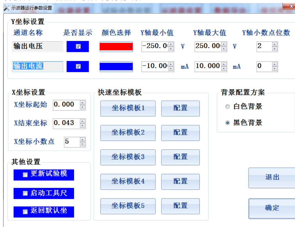
图 9 示波器设置

装置可以配置 5 个快速坐标模板，点击配置按钮，可以设置对应通道的 Y 坐标，X 坐标，颜色，显示的小数点位数等参数，并且配置的参数会被保存，当需要以某一个模板来显示当前曲线时，直接选择对应模板并确认后，则曲线的显示方式会被调整到当前所选择的模板参数