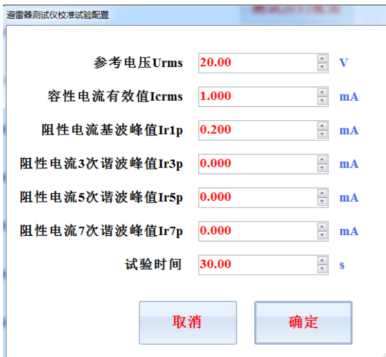
图 4 测试点参数配置

在参数设置界面可以对 T1-T10 每个点的具体输出电压和输出电流参数进行配置，电机对应的测试点配置，则可修改当前测试点的输出参数，测试点参数修改界面如图 4 所示。