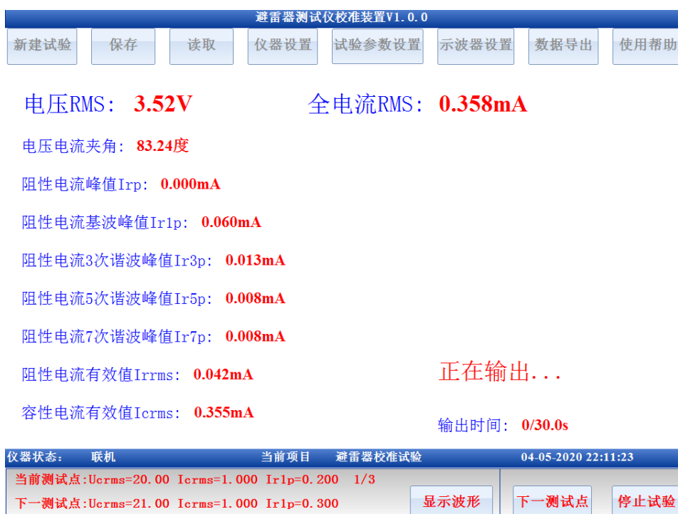
图 5 正在输出

试验参数设置完成后，点击开始试验则试验被启动，校准装置按照预先设定的流程依次输出对应的电压电流参数至被检测测试仪。