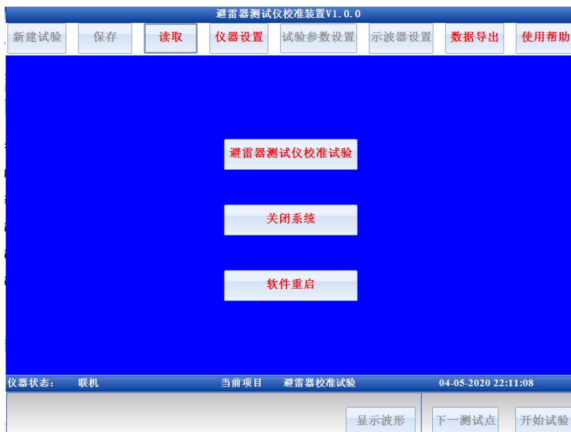
图 2 主界面

检查确认标准装置和测试仪按照图 1 所示的接线可靠连接后，开启装置电源，标准装置进入仪器主界面如图 2 所示