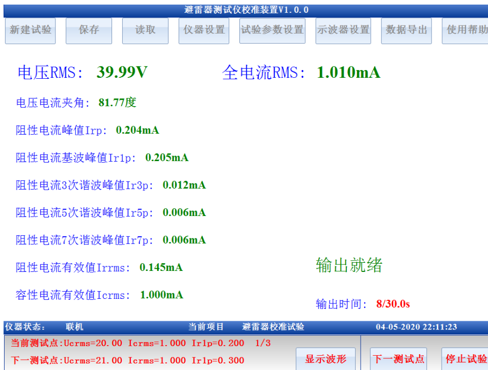
图 6 输出就绪

在进行校准装置输出试验时，可以选择文本显示界面，也可以显示波形界面，在试验主界面点击显示波形即可实时显示当前输出电压电流的波形曲线，并以波形方式来查看当前的标准电压电流信号。