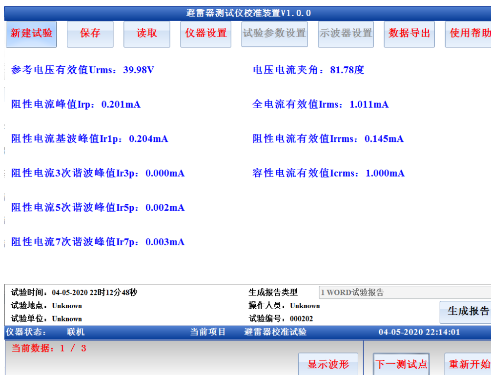
图 8 测试结果读取